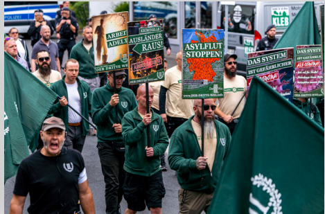
Selbsterklärte völkische Elite – Neonazis in Parteikleidung auf einer Demonstration in Hilchenbach, September 2022

„National, Revolutionär, Sozialistisch“ sowie das Parteilogo, bestehend aus einer römischen Drei (,,III.'), die von einem Lorbeerkranz umschlossen wird. Darüber hinaus finden sich in der Symbolwelt von Der III. Weg Schwerter, Flammen und Zahnräder, die in ihrer Verwendung zumeist auf nationalsozialistische und faschistische Organisationen rekurrieren, beispielsweise auf die nationalsozialistische Deutsche Arbeitsfront .