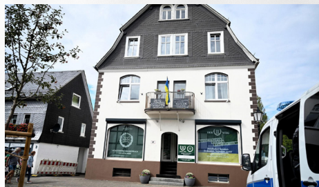
Immobilie von Der III. Weg in Hilchenbach, September 2022

Ein paar Dutzend Neonazis aus dem gesamten Bundesgebiet, da- runter der verurteilte Rechtster- rorist Karl-Heinz Statzberger aus München, versammelten sich auf der Ge- richtswiese neben dem Rathaus. Auf- grund des breiten und vielfältigen Gegen- protests blieben sie ohne Außenwirkung. Auch wenn Der III. Weg für größere Ver- anstaltungen auf die Mobilisierung ander- er ‚Landesverbände‘ angewiesen ist, führt die Immobilie in Hilchenbach zu sichtba- ren Raum- und Provokationsgewinnen vor Ort. Räume wie dieser wirken nicht nur nach außen, sondern auch nach innen als Infrastruktur für eigene Veranstaltungen.