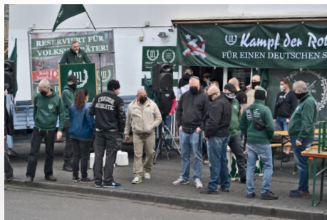
Kundgebung vor dem früheren Parteibüro in Siegen, Mai 2012

schaft‘ im Sinne einer ethnisch homogenen ‚Volksgemeinschaft‘. Zum Aktionsrepertoire der Partei gehören daher nicht nur klassische Demonstrationen, Infostände oder Flyerverteilungen, sondern auch Angebote der Festigung und Praktizierung völkisch-nationalistischer ‚Weltanschauung‘. Diese reichen von brauchtümlicher Folklore, über Kräuterkunde und Wanderungen bis hin zu Kampfsportkursen – auch für die eigenen Kinder.