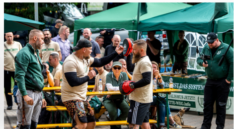
Kampfsporttraining auf dem ‚Tag der Heimattreue‘, September 2022

gebungen und eine Demonstration, in den von der Covid 19-Pandemie geprägten Jahren 2020 und 2021 waren es zusammengenommen ebenfalls 14 Kundgebungen und vier Demonstrationen. 4 Darunter fällt mit dem ‚Tag der Heimattreue‘ auch eine überregional beworbene Veranstaltung, die seit dem Jahr 2018 jährlich in Olpe und seit 2022 in Hilchenbach ausgerichtet wird. Neben Reden der führenden Parteikader, ‚Kampfspiele‘ für Kinder und dem Verkauf von Neonazi-Devotionalien, treten dort unter anderem rechtsextreme Musiker wie der Liedermacher Studio Drei aus Bad Laasphe auf.