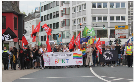
Aktivierung der Zivilgesellschaft – Proteste gegen eine Neonazi-Kundgebung in Siegen, April 2019

inhaltete. Die rassistische Mobilisierung von Der III. Weg und anderen rechten Akteuren gegen Geflüchtete blieb auch auf lokaler Ebene nicht ohne Folgen: In Kirchhundem (Kreis Olpe) gab es beispielsweise seit dem Jahr 2015 vier Brände an einer Unterkunft für Asylsuchende und auch in jüngerer Vergangenheit kam es im Sieger- und Sauerland immer wieder zu Brandanschlägen, beispielsweise auf ein syrisches Lebensmittelgeschäft in Siegen. 1