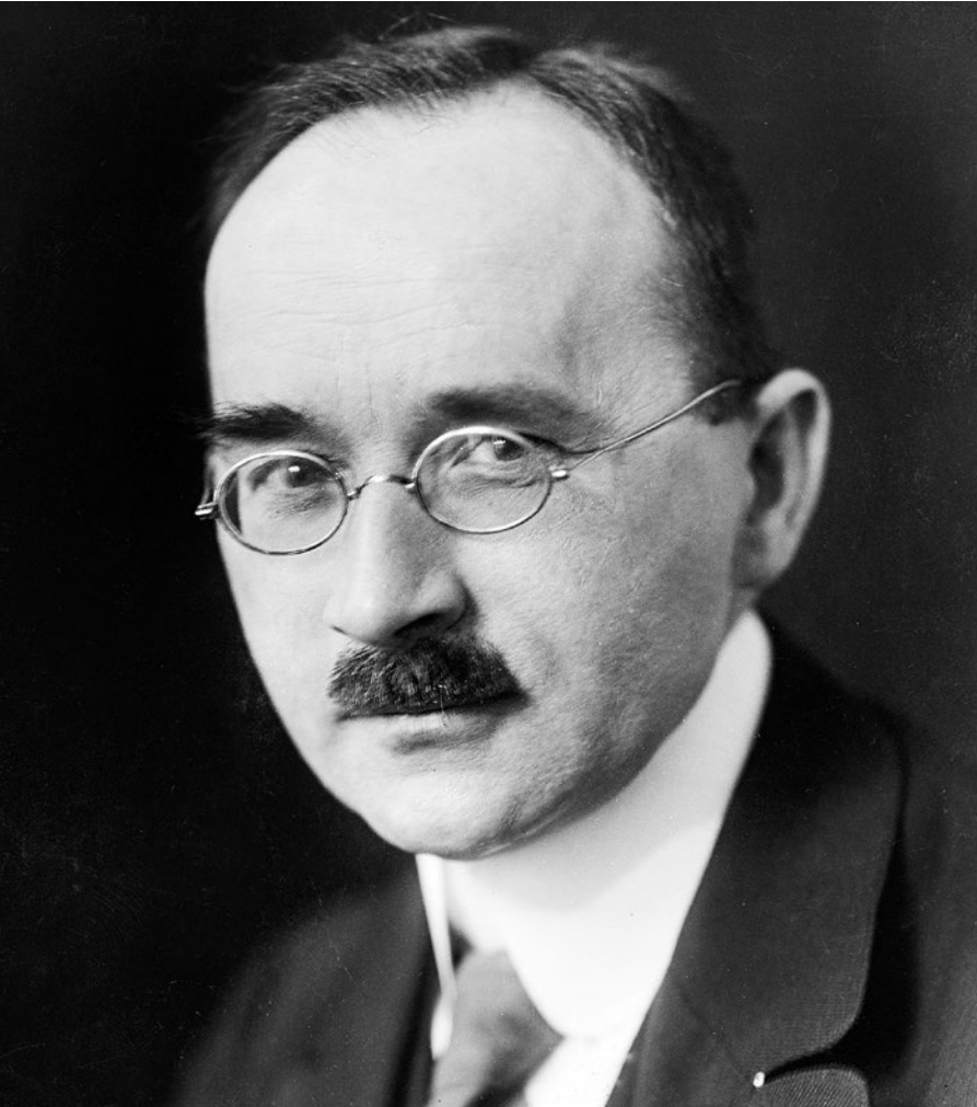
Abb.: ausserord. Prof. Dr.-Ing. Israel. In: SLUB Dresden / Deutsche Fotothek / Ursula Richter (um 1930)