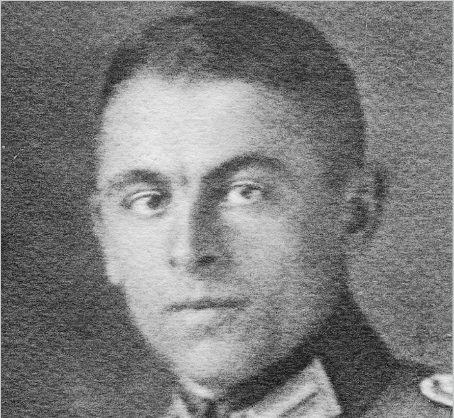
Abb.: Wolf-Dietrich von Xylander.