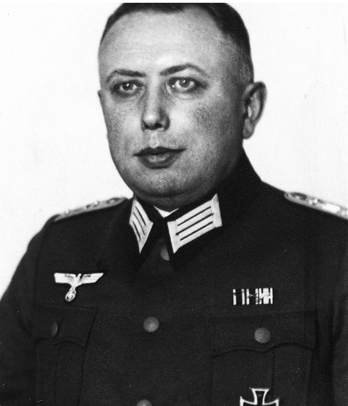
Abb.: Johannes Krüger. In: Bundesarchiv Freiburg Bundesarchiv-Militärarchiv Freiburg / PERS 6 / 10799