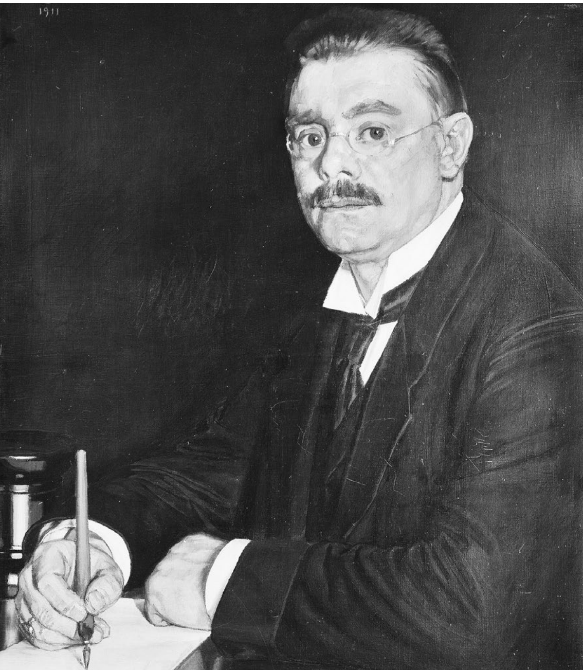
Abb.: Schriftsteller Ottomar Enking, Gemälde von Oskar Zwintscher. In: SLUB Dresden / Deutsche Fotothek / Oskar Zwintscher (1911)