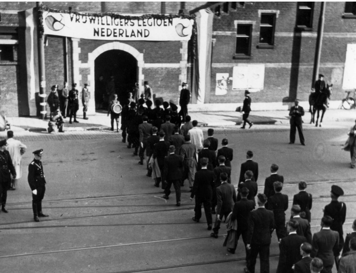
Abb.: Abfahrt des zweiten Kontingents der Freiwilligen-Legion Nederland aus Den Haag am 7. August 1941.