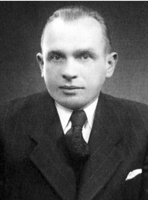
Abb.: Václav Rýdl. In: Stiftung Sächsische Gedenkstätten / Gedenkstätte Münchener Platz Dresden