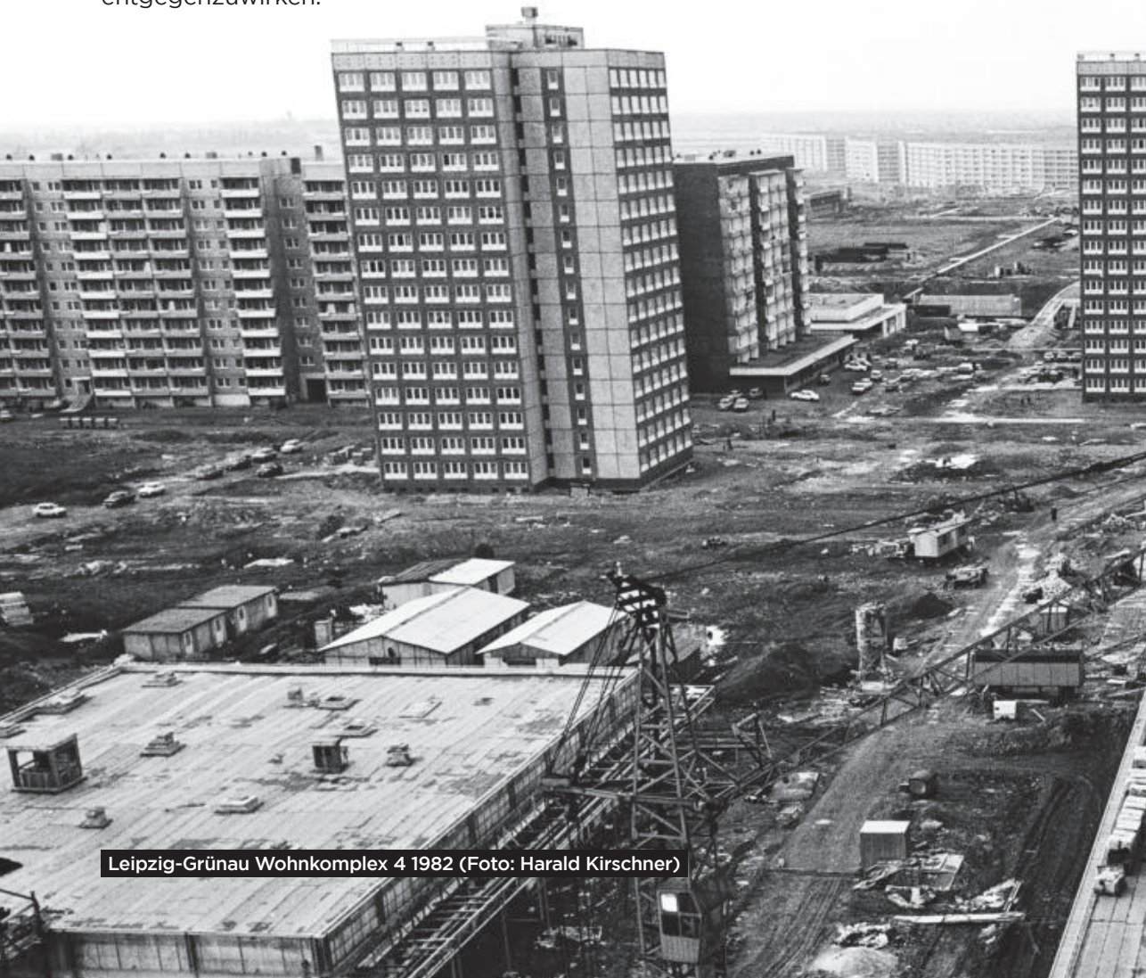
Leipzig-Grünau Wohnkomplex 4 1982

35 Im Sinne einer kommunalpolitischen Antwort (bei Anlässen) bzw. Planung (regelmäßige Jugendinfrastruktur/-hilfe).