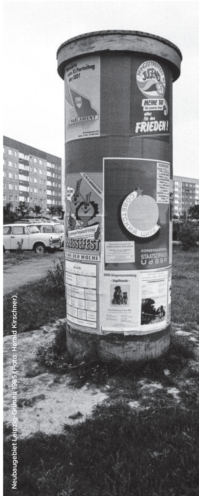
Neubaugelbiet Leipzig-Grünau 1985

Die politische Erfahrung in der Protestbewegung selbst, brachte bei vielen Bürger*innen eine kritische Haltung gegenüber etablierter, institutioneller Staatlichkeit mit sich, die noch heute anhält (vgl. Begrich 2022, S.112). Eine Dimension, welche auch in der gelebten Praxis der Jugendarbeiter*innen selbst eine Rolle gespielt haben könnte, beim Versuch, die eigenen Adressat*innen mit