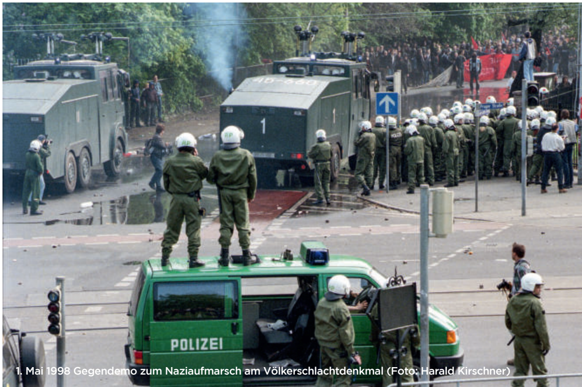
1. Mai 1998 Gegendemo zum Naziaufmarsch am Völkerschlachtdenkmal

Jugendlichen ein. Zum anderen setzten sie an deren Bedarfen und Interessen an, indem sie, dem damaligen fachlichen Gesamttrend folgend, die Cliquenarbeit bzw. die Cliquen selbst an oftmals eigens für sie geschaffene Räumlichkeiten banden und darüber die Beziehungen zu ihnen intensivierten.