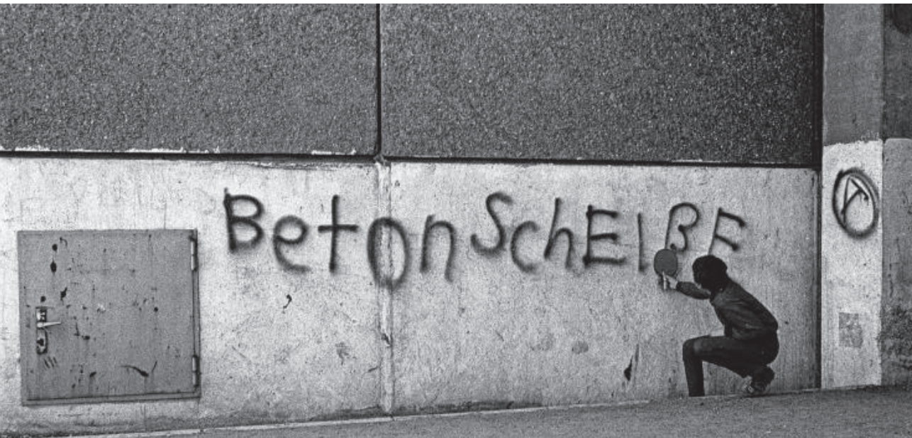
Straße der Jugend (Mannheimer Straße) 1981

Im engeren Bezug auf die Praxis bieten die Materialien zunächst ein anderes Bild. Hier steht im Vordergrund, dass die Interpretation der konzeptionellen Leitlinien oft dazu führte, sich besonders stark an vorgetragenen Bedürfnissen der Jugendlichen auszurichten. Zumindest zeigt das Material, dass die ersten fünf Jahre von Vorgehensweisen geprägt waren, die weniger konzeptgeleitet waren als unmittelbaren Erfordernissen folgten. Aus dem Mangel an formaler Qualifikation, Professionalität, aber auch Bewusstsein, Übersicht und Rückendeckung erklärt sich, dass in den Projekten vielfach die Gestaltung der Beziehungsebene zu den Adressat*innen im Vordergrund stand. Offenbar führte dies mitunter auch zu dem Problem, „professionelle Distanz“ aufzubauen