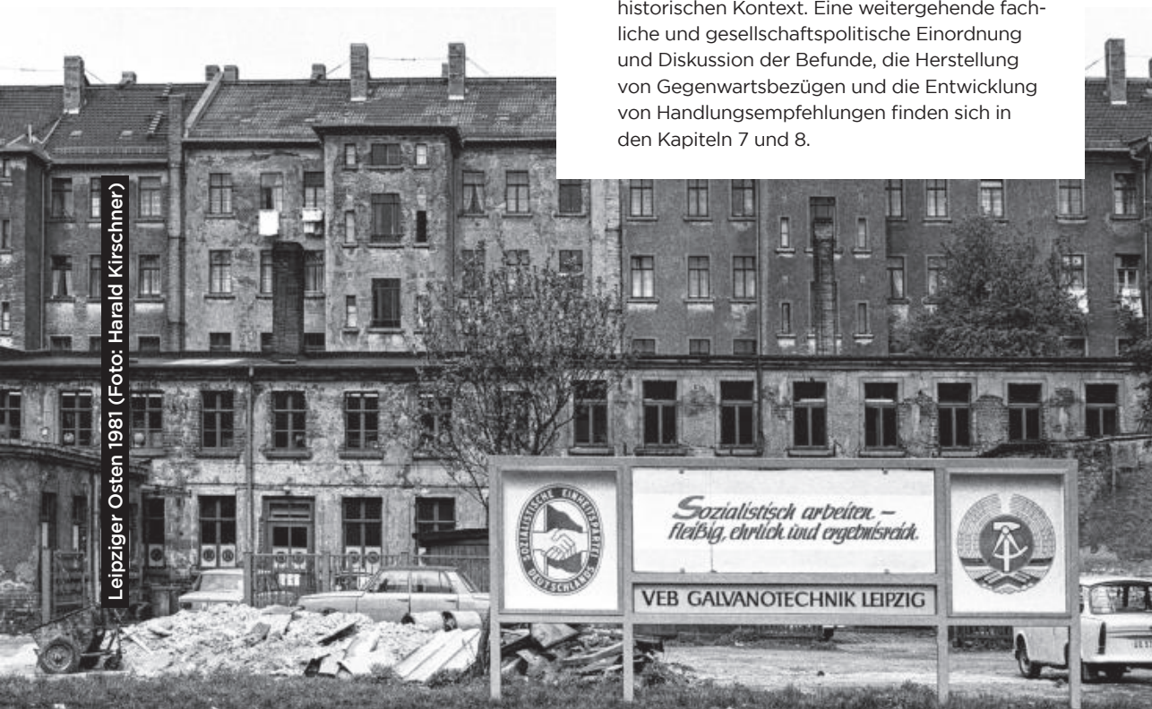
Leipziger Osten 1981

30 Diese Bilanzierung bleibt dicht am empirischen Material und belässt es so auch in seinem zeit-historischen Kontext. Eine weitergehende fachliche und gesellschaftspolitische Einordnung und Diskussion der Befunde, die Herstellung von Gegenwartsbezügen und die Entwicklung von Handlungsempfehlungen finden sich in den Kapiteln 7 und 8.