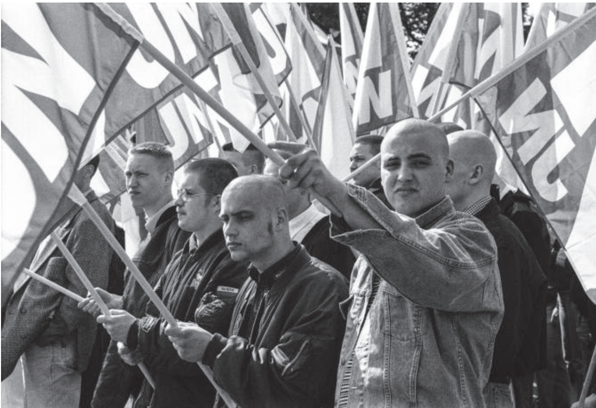
Naziaufmarsch 1. Mai 1998 Leipzig Völkerschlachtdenkmal

walttätigen Clique, als vielmehr quer durch unterschiedliche (subkulturelle) Lebenswelten. (Mobile) Jugendarbeit stellt für Teile der Szene und vor allem für organisierte Jugendliche und junge Erwachsene kein Angebot dar, welches lebensweltlich in Besitz genommen werden will. Häufig wird sich Kontaktangeboten vollständig entzogen. Dagegen sind Fachkräfte mit pauschalisierenden Ablehnungshaltungen und gruppenbezogener Menschenfeindlichkeit als fester Bestandteil einer durch Jugendliche gelebten und inszenierten „Normalität“ konfrontiert, die ihren Ursprung in der erlebten sozialräumlichen Alltagsrealität und nicht zuletzt in der Elterngeneration, der „Generation Hoyerswerda“ (Kleffner/Spangenberg 2016) haben.