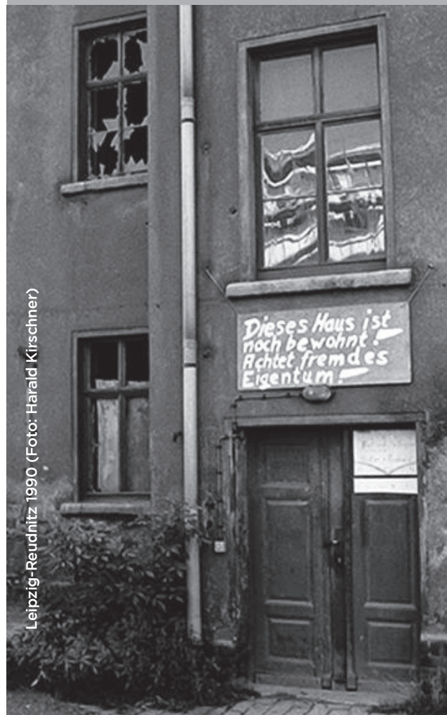
Leipzig-Reudnitz 1990

„Der Landesarbeitskreis steht für Menschenfreundlichkeit und gegen Menschenverachtung, steht für Respekt und gegen Hass ein, steht für ein Miteinander und gegen Ausgrenzung. Antidemokratische oder diskriminierende Strömungen, Vereine und Parteien sowie die Agitation für solche Gruppen, die insbesondere die Merkmale der pauschalisierenden Ablehnungskonstruktionen zeigen, sind unvereinbar mit Menschenrechten und unvereinbar mit den Werten und Zielen des Arbeitsfeldes sowie sozialer Arbeit und somit des Landesarbeitskreises Mobile Jugendarbeit.“ (Präambel der Satzung des LAK MJA).