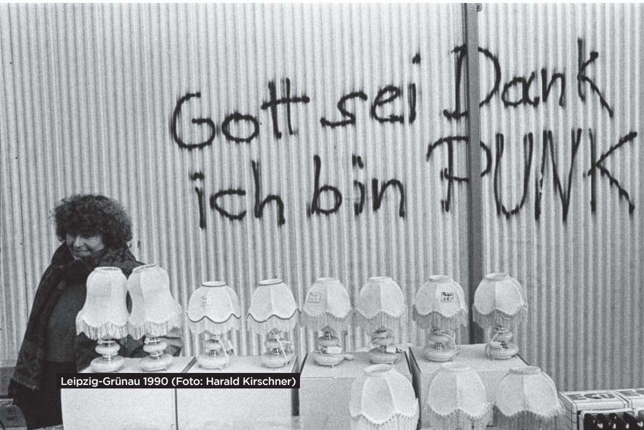
Leipzig-Grünau 1990

Doch keine*r der befragten Jugendarbeiter*innen, die während der 90er